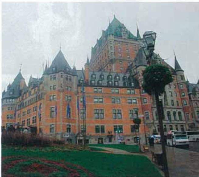
ケベックのシンボル シャトー・フロンテナック

今回は、秋の紅葉が世界的に有名なロレンシャン高原とカナダが世界に誇るエンターテインメント“シルクドソレイユ”鑑賞をメインとした大自然と文化を体感する表敬訪問となりました。