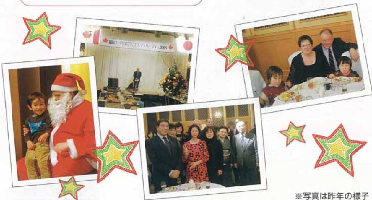
※写真は昨年の様子