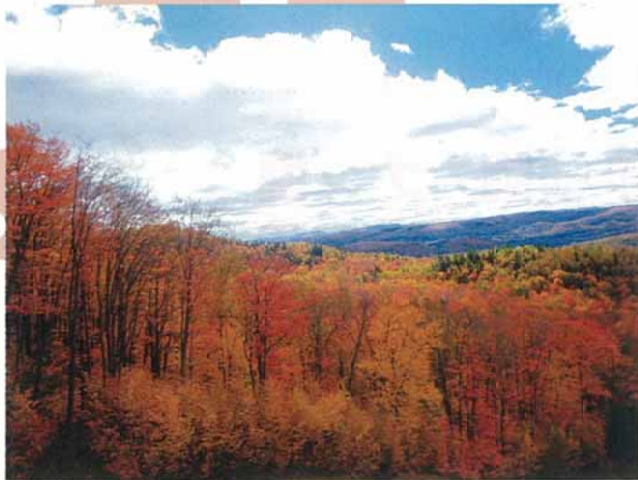
紅葉の美しいロレンシャン高原