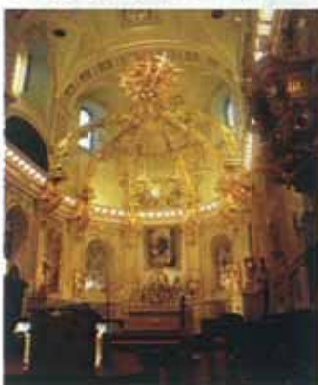
ノートルダム聖堂

また、2日目には現地で活動されているケベックー日本友好協会との交流会を行いました。現地からはケベック州国際関係省からの出席者を含む27名の方にご参加いただきました。日加友好という同じ目的を持つ団体ということもあって、話は尽きず予定時間を大幅に延長しました。最後は「博多手一本」でお開きとしました。