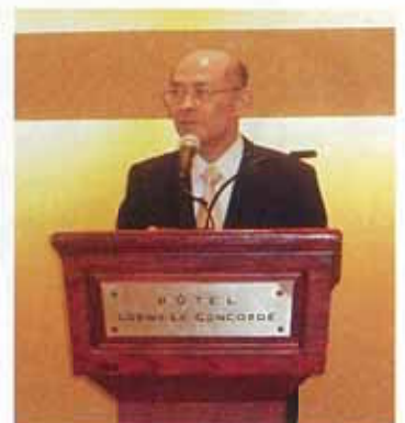
録田会長のご挨拶