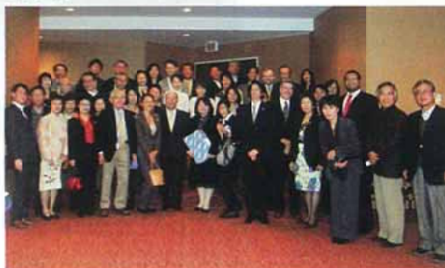
ケベックー日本友好協会との交流会