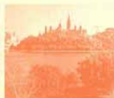
そびえ立つオタワ国会議事堂