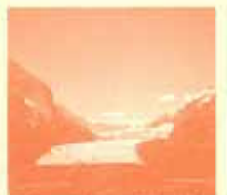
山間に広がるコロンビア大水源