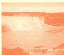
ダイナミックなナイアガラの滝