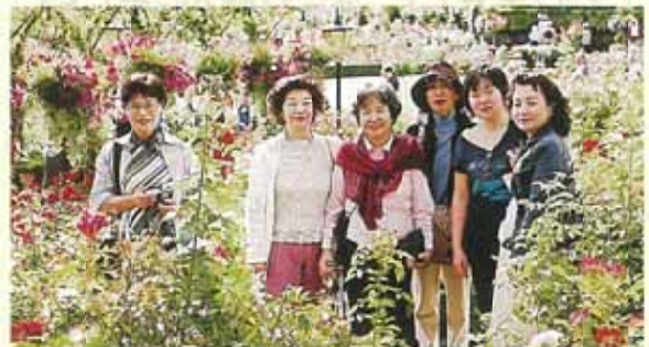
ブッチャートガーデンにて