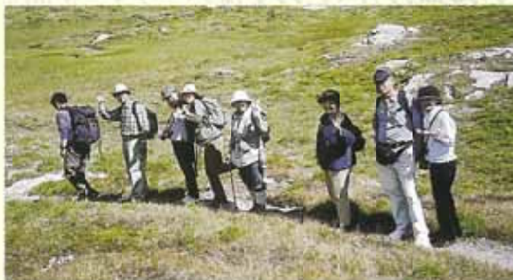
カナディアンロッキーハイキング