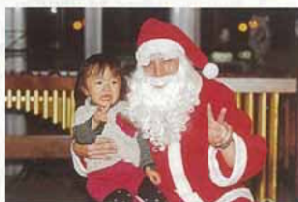
クリスマスパーティー