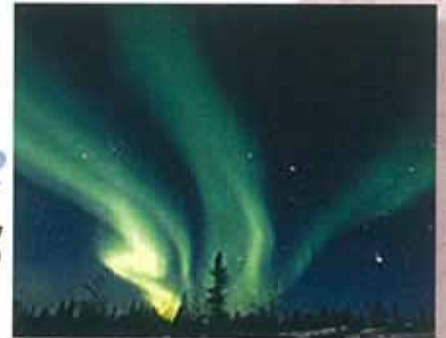
イエローナイフ