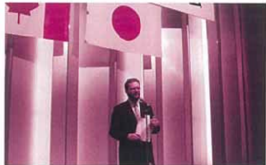
懇親会でご挨拶されるステファン・ジョベ参事官