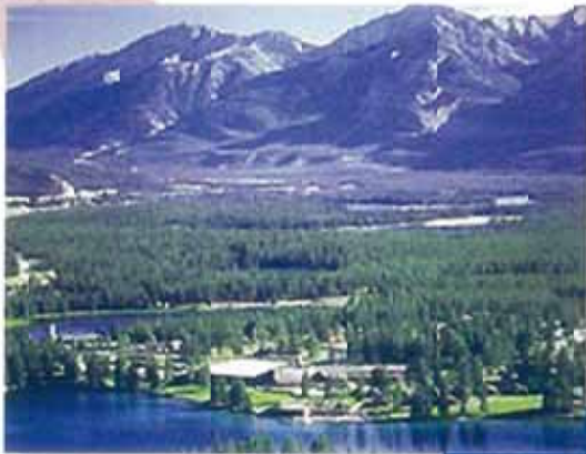
ジャスパー国立公園