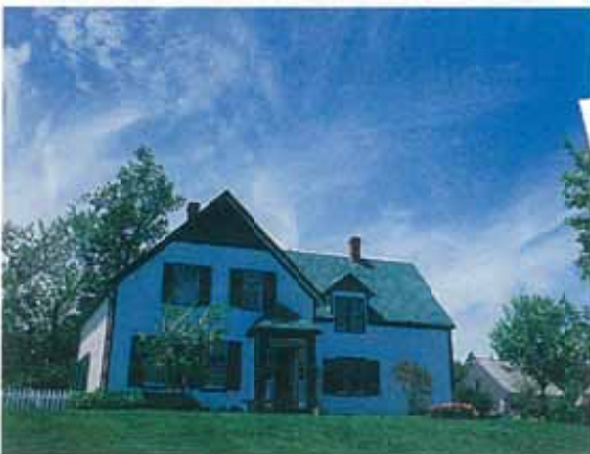
プリンスエドワード島 アンの家