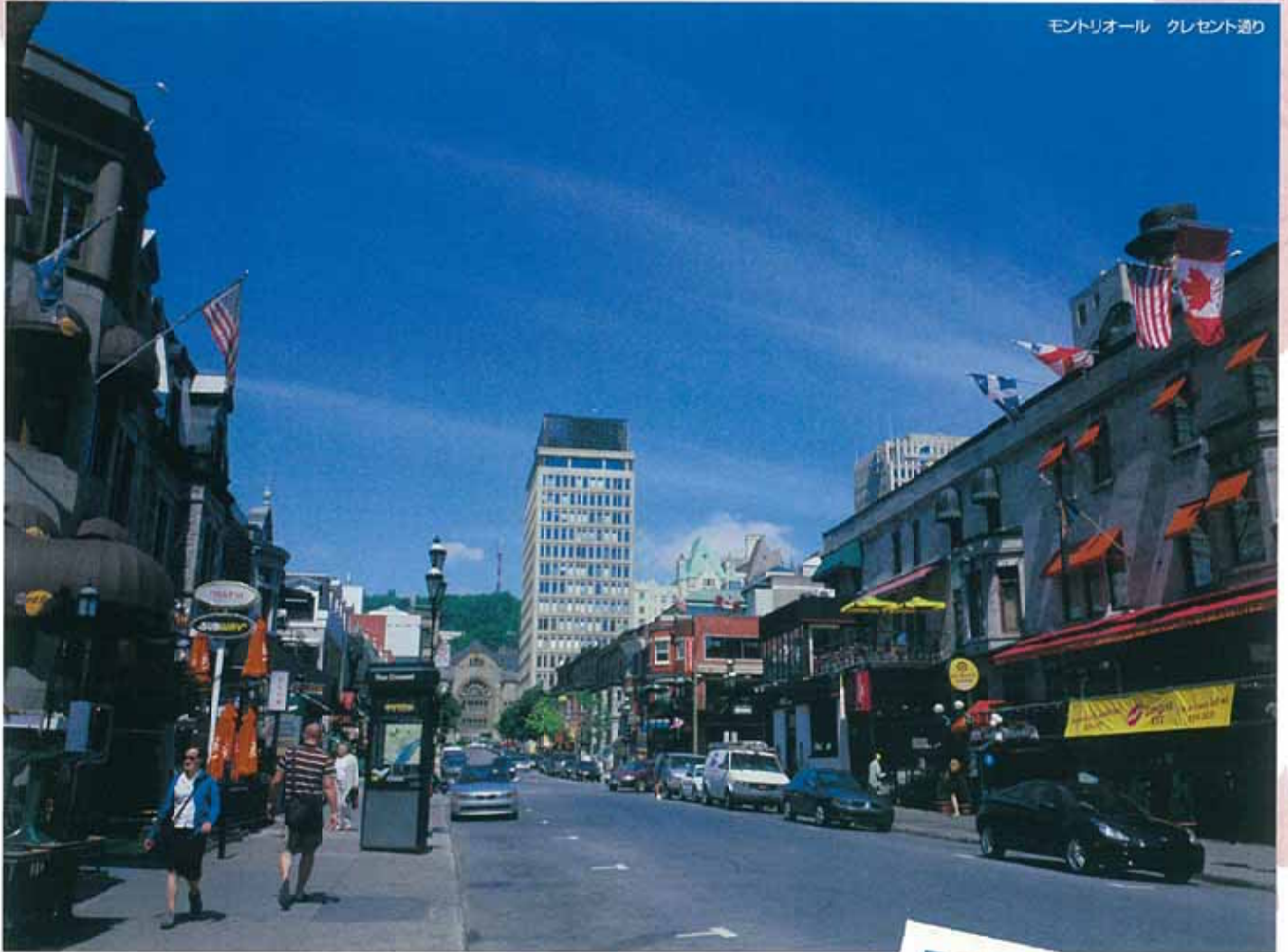
モントリオール クレセント通り