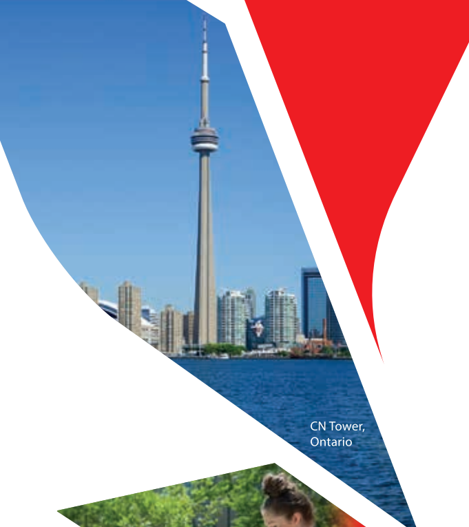
CN Tower, Ontario