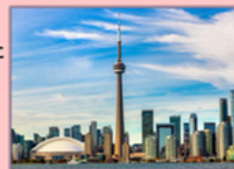
トロント・CNタワー

正しくご案内は後日改めてお送りいたします。皆さまのご参加のお申し込みをお待ちしております。