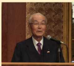
貴名名誉領事 挨拶