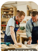
木工スタジオの様子

しかし、こうした革新的な建築表現とは対照的に、カナダに来ると見逃せない文化があります。それは木工文化であり、特にミシガでは、その文化が今も大切にされています。かつてクレジッソ川はストリーツビルやエリンデルといった村の製材所を支え、この地域の発展を後押ししました。その歴史は今も静かに息づき、芸術的な形で受け継がれています。ミシガには木工職人やアーティストのコミュニティがあり、手彫りのノミで木材を家具へと仕上げる技術を大切にしています。リビング・アーツ・センターでは木工スタジオが賑わい、住民が伝統的な技法と現代的なデザインを融合させながら作品を生み出しています。急速な都市成長の中で、木の質感や木目、そして時間をかけて手作業で作り上げるという文化が息づいているのです。トロント周辺を訪れる際は、ぜひミシガにお立ち寄りください。都市の景観と自然の美しさ、その両方を楽しめる場所は他にありません。