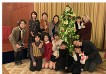
▲参加者のみなさん